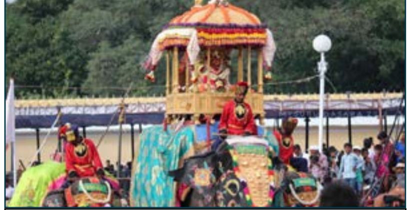
ಚಿನ್ನದ ಅಂಬಾರಿ ಹೊತ್ತು ಸಾಗುತ್ತಿರುವ ಅರ್ಜುನ ಬಲ ಭಾಗದಲ್ಲಿ ಕಾವೇರಿ, ಎಡ ಭಾಗದಲ್ಲಿ ವರಲಕ್ಷ್ಮಿ ಆನೆ ಬೆಂಬಲವಾಗಿ ಸಾಗಿದವು.