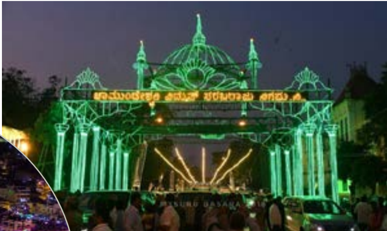
ರಾಜ್ಯದಲ್ಲಿ ಮೊದಲ ಬಾರಿಗೆ ಲ್ಯಾಂಟರ್ನ್ ಉತ್ಸವ, ಬಣ್ಣದ ಬಣ್ಣದ

ಪ್ರತಿಕ್ರಮಿಸಿ ಹಾಗೂ ಪ್ರಸಿದ್ಧ ಕಟ್ಟಡಗಳು ಬೆಳಕಿನ ಚಿತ್ರಾದಲ್ಲಿ ಮುಳುಗಲು ಕಾರಣರಾಗಿದ್ದಾರೆ. R.G.B- LED ಬಳಕೆ: ಬಹು ಬಣ್ಣಗಳನ್ನು ಪ್ರದರ್ಶಿಸುವ ಆರ್.ಜಿ.ಬಿ(ರೆಡ್, ಗ್ರೀನ್, ಬ್ಲೂ) ಎಲ್.ಇ.ಡಿ ಬಲ್ಬ್‌ಗಳನ್ನು ಬಳಸಿ ದೀಪಾಲಂಕಾರ ಮಾಡಲಾಗಿದೆ. ಡಿ, ದೇವರಾಜ ಅರಸು ರಸ್ತೆ, ಹಾಗೂ