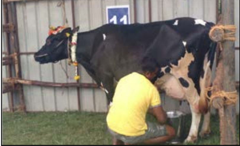
ಹಾಲು ಕರೆಯುವ ಸ್ಪರ್ಧೆಯಲ್ಲಿ ನಿರತರಾಗಿರುವ ಸ್ಪರ್ಧಿ