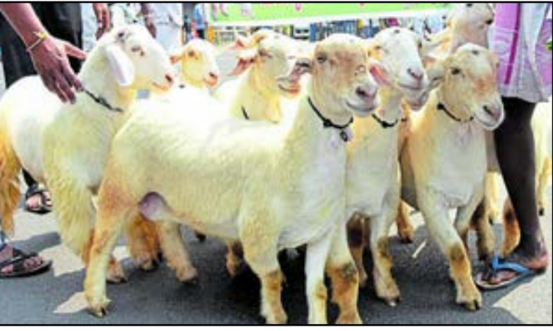
ನಗರದಲ್ಲಿ ಶುಕ್ರವಾರ ನಡೆದ ರೈತರ ದಸರಾ ಮೆರವಣಿಗೆಯಲ್ಲಿ ಬನ್ನೂರು ಕುರಿಗಳು ಸಾಗಿದವು

ಬಿಂದಿಗೆ ಹೊತ್ತು ಓಡುವ ಸ್ಪರ್ಧೆಗಳಿದ್ದವು. ಇದಕ್ಕೆ ಪ್ರೋತ್ಸಾಹದಾಯಕವಾಗಿ ಪ್ರಥಮ, ದ್ವಿತೀಯ, ತೃತೀಯ ಬಹುಮಾನಗಳನ್ನು ನೀಡಿದರು. ರೈತ ದಸರದ ಪ್ರಮುಖ ಭಾಗವಾದ ಹಾಲು ಕರೆಯುವ ಸ್ಪರ್ಧೆಯು ಆಕರ್ಷಣೆಯಾಗಿತ್ತು. ಇಲ್ಲಿ ಅತ್ಯಧಿಕ ಹಾಲು ಕರೆಯುವ ಸ್ಪರ್ಧೆಯಾಗಿದ್ದು ರಾಜ್ಯದ ನಾನಾ ಕಡೆಗಳಿಂದ ತಮ್ಮ ಹಸುಗಳೊಡನೆ ಸ್ಪರ್ಧಿಗಳು ಆಗಮಿಸಿದ್ದರು. ಮತ್ತು ಈ ಸ್ಪರ್ಧೆಯು ಗೋಪಾಲಕರಿಗೆ ಸ್ಪೂರ್ತಿದಾಯಕವಾಗಿತ್ತು. ಇದರ ಜೊತೆಗೆ ಅತಿ ಹೆಚ್ಚು ಹಾಲು ಕರೆಯುವ ಸ್ಪರ್ಧಿಗಳಿಗೆ ಪ್ರೋತ್ಸಾಹದಾಯಕವಾಗಿ ಬಹುಮಾನ ನೀಡುವುದರ ಮೂಲಕ ಪಶುಸಂಗೋಪನೆಯ ಕಡೆ ರೈತರಲ್ಲಿ ಹೆಚ್ಚು ಒಲವು ಮೂಡಿಸಿದರು. ಒಟ್ಟಾರೆಯಾಗಿ ಅನ್ನದಾತರಿಗೆ ಗೌರವ ನೀಡುವ ಒಂದು ಕಾರ್ಯಕ್ರಮಕ್ಕೆ ರೈತದಸರಾ ಪ್ರತ್ಯಕ್ಷ ಸಾಕ್ಷಿಯಾಗಿತ್ತು.