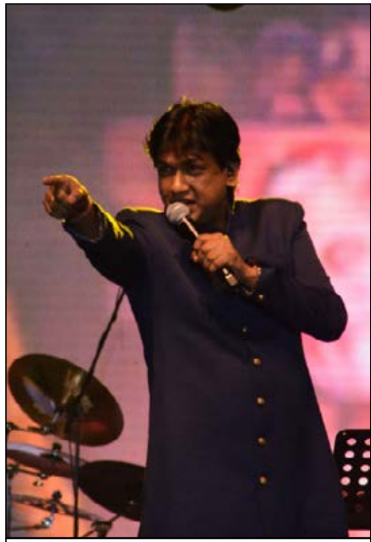
ಯುವ ದಸರಾದಲ್ಲಿ ಖ್ಯಾತ ಗಾಯಕ ವಿಜಯ್ ಪ್ರಕಾಶ್