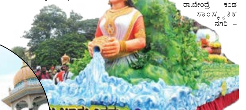
ಪ್ರಥಮ ಬಹುಮಾನ ಪಡೆದ ಕಾವೇರಿ ನೀರಾವರಿ ನಿಗಮದ ಸ್ವಬ್ಧಚಿತ್ರ

ಅಣೆಕಟ್ಟು ಸ್ವಬ್ಧಚಿತ್ರಕ್ಕೆ ತೃತೀಯ ಬಹುಮಾನ ದೊರಕಿತು. ಕ್ರಮವಾಗಿ - 20 ಸಾವಿರ, - 10 ಸಾವಿರ ನಗದು ಬಹುಮಾನ ನೀಡಲಾಗುವುದು ಎಂದು ಸ್ವಬ್ಧಚಿತ್ರ ಉಪಸಮಿತಿಯ ಅಧಿಕಾರಿಗಳು ತಿಳಿಸಿದರು. ಸಮಾಧಾನಕರ ಬಹುಮಾನ : ಮೆರವಣಿಗೆಯಲ್ಲಿ ಮೊದಲ ಬಾರಿ ಭಾಗವಹಿಸಿದ ಎನ್‌ಸಿಸಿಯ 'ಪ್ರವಾಹ ಸಂತ್ರಸ್ತರಿಗೆ ನೆರವು ಮತ್ತು ಕ್ರೀಡೆಗಳು' ಹಾಗೂ ಧಾರವಾಡದ 'ದ. ರಾ.ಬೇಂದ್ರೆ ಕಂಡ ಸಾಂಸ್ಕೃತಿಕ ನಗರಿ -