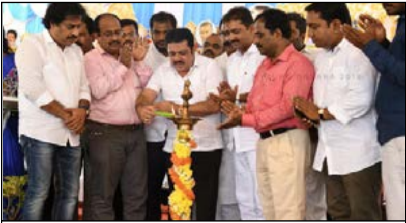
ಆಹಾರ ಮೇಳವನ್ನು ಆಹಾರ ಮತ್ತು ನಾಗರಿಕ ಸರಾಬರಾಜು ಸಚಿವರಾದ ಜಮೀರ್ ಅಹ್ಮದ್ ಖಾನ್ ದೀಪಾ ಬೆಳಗಿಸುವುದರ ಮೂಲಕ ಉದ್ಘಾಟಿಸುತ್ತಿರುವುದು.

ರಾಜೇಶ್ವರಿ. 'ಹಾ ಗೌಜಲಕ್ಕಿ, ಬಾರ್ಬಿ ಕ್ಯೂ ಚಿಕನ್, ಕಾಸ್ತಾವ ಆಯಂಡ್ ಸ್ಟೀಟ್ಸ್, ಆಹಾ ನೋಡುತ್ತಿದ್ದರೆ ಬಾಯಿ ಚಿಪ್ಪರಿಸುತ್ತೆ. ಆದರೆ, ಇದಕ್ಕೂ ಮುನ್ನ ನಾನು ಇದ್ದಾವುದನ್ನು ತಿಂದಿಲ್ಲ. ಅಯ್ಯೋ ತಿಂದೆ ಇದೆ ಏನಂತೆ, ಬಾ ಇವತ್ತು ತಿಂದು ನೋಡುವಾ' ಇಂತಹದೊಂದು ಸಂಭಾಷಣೆ ಕೇಳಿ ಬಂದದ್ದು, ದಸರಾ ಆಹಾರ ಮೇಳದಲ್ಲಿ. ಹೌದು! ವಿಶ್ವವಿಖ್ಯಾತ ದಸರಾ ಉತ್ಸವದ ಅಂಗವಾಗಿ ಭಾರತೀಯ ಸ್ಪೋರ್ಟ್ಸ್ ಆಂಡ್ ಗೈಡ್ಸ್ ಮೈದಾನ ಮತ್ತು ಲಲಿತ್ ಮಹಲ್ ಪಕ್ಕದ ಮಾತ್ರ ತಯಾರಿಸಲಿದ್ದು, 1 ಫ್ಲೇಟ್ಗೆ 100 ರೂ.ನಿಗದಿಪಡಿಸಲಾಗಿದೆ. ಮುಧ್ಡೆ, ನಳ್ಳಿ ಸಾರು: ಬುಡಕಟ್ಟು ಸಮುದಾಯದವರು ಹಾಕಿರುವ ಮಳಿಗೆಯಲ್ಲಿ ಗ್ರಾಮೀಣ ಭಾಗದ ಊಟವಾದ ಮುಧ್ಡೆ ಮತ್ತು ನಳ್ಳಿ ಸಾರು ಊಟ 100ರೂ.ಗೆ ಶುಕ್ರವಾರದಿಂದ ಸಿಗಲಿದೆ. ಇದಲ್ಲದೆ ಮಾಗಳ್ಳಿ ಟೀ, ಒಂದು ಬೌಲ್ ಗಣಿಸಿನ ಜತೆ ಜೇನು ತುಪ್ಪ ಬಂಬೂ ಬಿರಿಯಾನಿ ಮತ್ತು ಬಿದಿರಕ್ಕೆ ಪಾಯಸ ಸೇರಿದಂತೆ ಹಲವು ಬುಡಕಟ್ಟು ಸಮುದಾಯದ ಆಹಾರ ದೊರೆಯಲಿದೆ. ವಿವೇಶಿ ಆಹಾರ: ಮೈಸೂರು ವಿವಿ ಅಂತಾರಾಷ್ಟ್ರೀಯ ವಿವೇಶಿ ವಿದ್ಯಾರ್ಥಿಗಳ ಒಕ್ಕೂಟ, ಅಂತಾರಾಷ್ಟ್ರೀಯ ಕೇಂದ್ರದಿಂದ ಆಹಾರದ ಮೇಳ ಪ್ರವೇಶದ ದ್ವಾರದ ಎಡ ಭಾಗದಲ್ಲಿ ವಿವೇಶಿ ಆಹಾರ ಮಳಿಗೆ ಹಾಕಲಾಗಿದೆ. ಆಹಾರ ಮೇಳದ 9ದಿನವೂ 12ದೇಶಗಳ ವಿದ್ಯಾರ್ಥಿಗಳ ಒಂದೊಂದು ತಂಡ, ತಮ್ಮ ದೇಶದ ಆಹಾರ ತಯಾರಿಸಿ ಮಾರಾಟ ಮಾಡಲಿದ್ದಾರೆ. ಮೊದಲ ದಿನ ಬುಧವಾರ ಯೆಮನ್ ದೇಶದ ವಿದ್ಯಾರ್ಥಿಗಳು ಮೇಳದಲ್ಲಿ ಮಳಿಗೆ ಹಾಕಿದ್ದರು. ರೈಸ್ ಚಿಕನ್, ಕಾಸ್ತಾವ ಅ?ಯಂಡ್ ಸ್ಟೀಟ್ಸ್, ಬಾರ್ಬಿ ಕ್ಯೂ ಚಿಕನ್ ಮಾರಾಟ ಮಾಡಿದರು. 98+75 ಮಳಿಗೆಗಳು: ಸ್ಪೋರ್ಟ್ಸ್ ಗೈಡ್ಸ್ ಮೈದಾನದಲ್ಲಿ 98 ಮಳಿಗೆಗಳು ಮತ್ತು ಲಲಿತ್ ಮಹಲ್ ಪಕ್ಕದ ಮೈದಾನದಲ್ಲಿ 75 ಮಳಿಗೆಗಳನ್ನು ಮೊದಲ ದಿನವೇ ತೆರೆಯಲಾಗಿದೆ. ಸಸ್ಯಹಾರಿ ವಿಭಾಗದಲ್ಲಿ ಎಣ್ಣೆ ಗಾಯಿ ರೊಟ್ಟಿ, ಗಿರ್ಮಿಟ್ಸ್, ಬಂಗಾರ್ಪೇಟ್ ಚಾಟ್, ಹೋಳಿಗೆ ಇದ್ದರೆ. ಅರಬ್ಬಿ ಬಿರಿಯಾನಿ, ದುಬೈ ಸ್ಪೆಷಲ್ ಬಿರಿಯಾನಿ, ಮಡಕೆ ಬಿರಿಯಾನಿ, ಸಮುದ್ರ ಮೀನಿನ ಫ್ರೈ ಮಾಂಸಹಾರದ ಪ್ರಮುಖ ತಿನಿಸುಗಳಾಗಿವೆ.