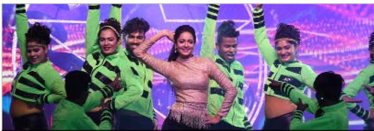
ಯುವ ದಸರಾದ ಸ್ಯಾಂಡಲ್ ವುಡ್ ನೈಟ್‌ನ ಕಾರ್ಯಕ್ರಮ