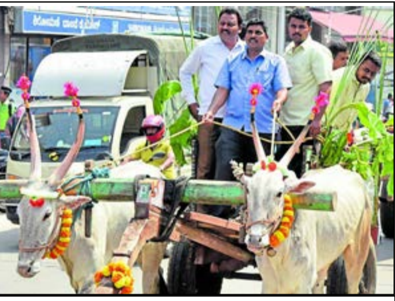
ರೈತ ದಸರಾದ ಮೆರವಣಿಗೆಯಲ್ಲಿ ಪಾಲ್ಗೊಂಡು ಎತ್ತಿನ ಗಾಡಿ ಮೂಲಕ ಜೆ.ಕೆ ಮೈದಾನಕ್ಕೆ ಆಗಮಿಸಿದ ರೈತರು.