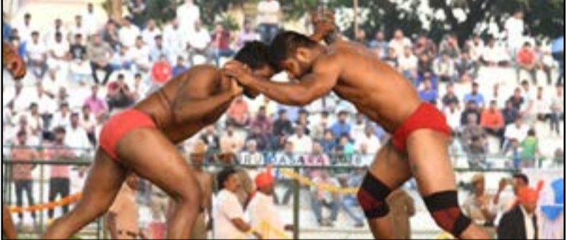
ದಸರಾ ನಾಡಕುಸ್ತಿ ಅಖಾಡದಲ್ಲಿ ಸ್ಪರ್ಧಿಗಳು