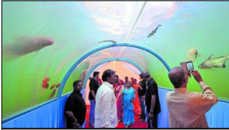
ಮೈಸೂರಿನ ಜೆ.ಕೆ.ಮೈದಾನದಲ್ಲಿ ಶುಕ್ರವಾರ ಆರಂಭವಾದ ಮತ್ಸ್ಯಮೇಳದಲ್ಲಿ ಆಕರ್ಷಣೆಯ ಕೇಂದ್ರ ಬಿಂದುವಾಗಿರುವ ಸುರಂಗ ಅಕ್ಷೇರಿಯಂ (ಟನಲ್ ಅಕ್ಷೇರಿಯಂ)