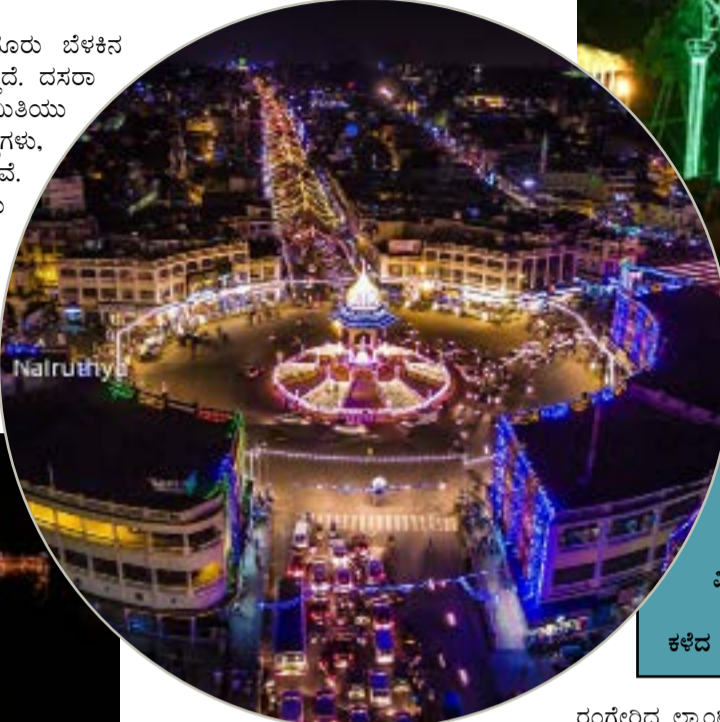
ಮಾನಸಗಂಗೋತ್ರಿಯ ಬಯಲು ರಂಗಮಂದಿರ ರಸ್ತೆಗಳಲ್ಲಿ ಇವನ್ನು ಅಳವಡಿಸಲಾಗಿದೆ. ಬುಲೆವಾರ್ಡ್, ಚಾಮುಂಡಿ ಬೆಟ್ಟದ ರಸ್ತೆಗಳಲ್ಲಿ ವಿಶೇಷವಾಗಿ ದೀಪಾಲಂಕಾರಗಳಿವೆ.

ರಂಗೇರಿಂದ ಲ್ಯಾಂಟರ್ನ್ ಪಾರ್ಕ್ ಈ ಬಾರಿಯ ದಸರಾದಲ್ಲಿ ಲ್ಯಾಂಡರ್ನ್ ಉತ್ಸವ ವಿಶೇಷವಾಗಿ ಎಲ್ಲರ ಆಕರ್ಷಣೀಯ ಕೇಂದ್ರವಾಗುತ್ತಿದೆ. ದಸರಾ ವಸ್ತುಪ್ರದರ್ಶನ ಆವರಣದಲ್ಲಿ 15ಸಾವಿರ ಚದರ ಅಡಿ ಪ್ರದೇಶದಲ್ಲಿ ನಿರ್ಮಾಣವಾಗಿರುವ ಲ್ಯಾಂಟರ್ನ್ ಪಾರ್ಕ್ ಅಲ್ಲಿ ಚೀನಾದ ಓಷಿಯನ್