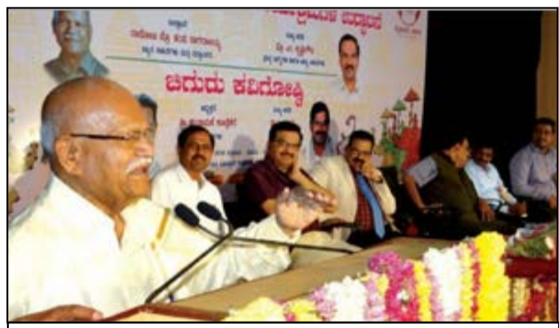
ದಸರ ಕವಿಗೋಷ್ಠಿಯಲ್ಲಿ ನಾಡೋಜ ಕವಿ ಹಂಪನಾಗರಾಜಯ್ಯ ಕವಿಗೋಷ್ಠಿಯಲ್ಲಿ ಮಾತನಾಡುತ್ತಿರುವುದು.