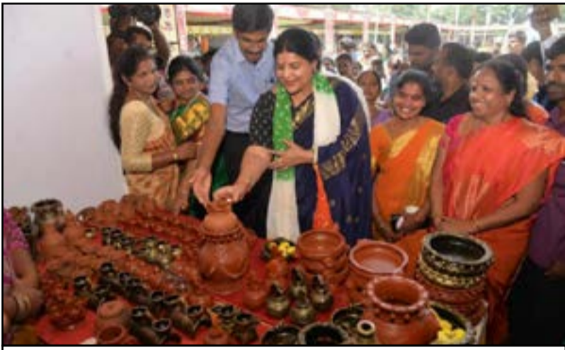
ಕರಕುಶಲ ವಸ್ತುಗಳನ್ನು ವೀಕ್ಷಿಸುತ್ತಿರುವ